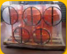
Ladung mit unterschiedlichen Formen, palettiert oder unpalettiert