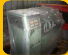
Maschinen mit Sonderabmessungen