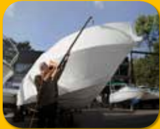
Überwinterung und Außenlagerung von Booten