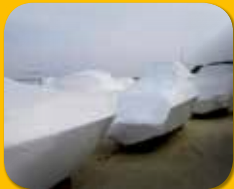
Auslieferung und saubere Übergabe