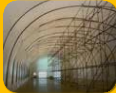
Temporäre Abdeckung von Strukturen