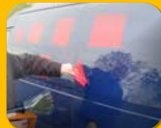
Ablösen von Klebefolien