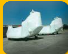
Luftfahrt, militärische Anwendungen ...etc