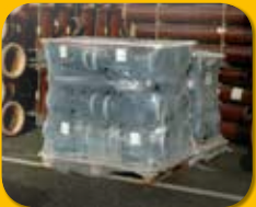
Schwere, zerbrechliche, instabile Ladung