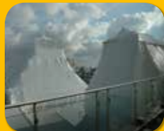
Witterungsschutz bei Baumaßnahmen