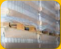
Palette mit Glaswaren